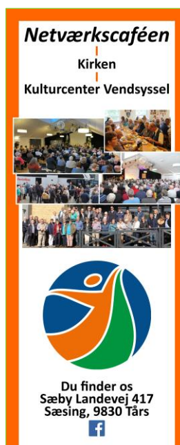
Roll-up for Foreningen OPTIMISTERNE og for Netværkscaféen i Kirken i Kulturcenter Vendsyssel