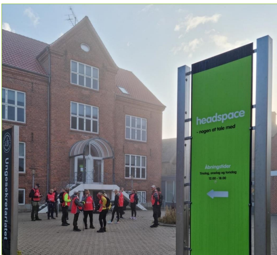
14 morgenfriske var med, da Marchen gik mod Brønderslev søndag morgen kl. 8.