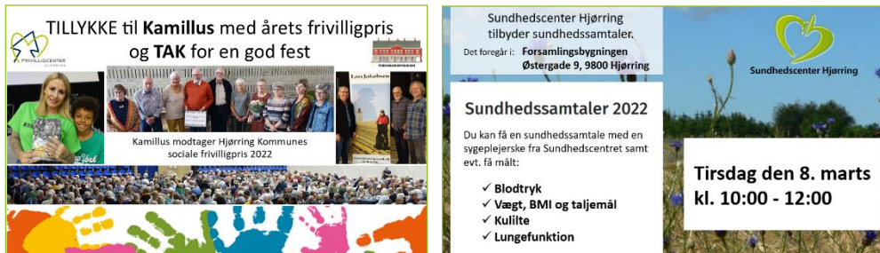
Opslag til infoskærme

FCH designer og formidler opslag til Hjørring Antenneselskabs Infokanal (HAS) og, hvis relevant, Hjørring Kommunes infoskærme, herunder bibliotekerne i Hjørring kommune. Til eksempel: