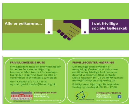
For- og bagside. Flyer opdateret i år

FCH formidler informationer om Frivillighedens Huse og FCH i en lille to-sidet flyer.