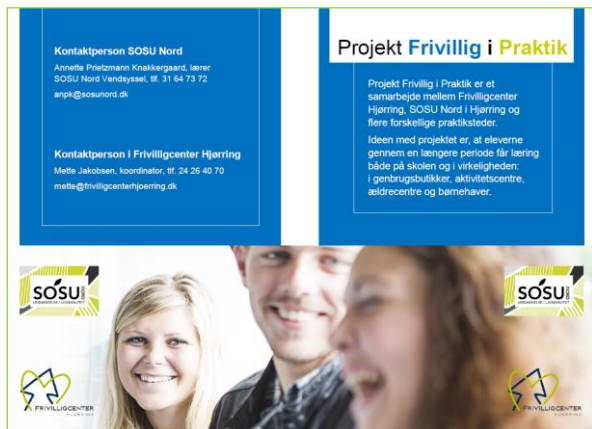
Folder for Projekt Frivillig i Praktik / SOSU Nord

FCH laver design og layout på PR og begivenheder for frivillige sociale foreninger og samarbejdspartnere. Og tager billeder på foranledning. Til eksempel: