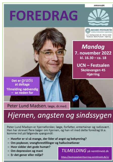
A3-plakat og SoMe-brug / Bedre Psykiatri - Lokalforening Hjørring

På vegne af Frivilligcenter Hjørrings bestyrelse