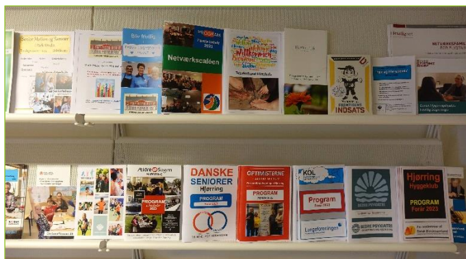
Reol på kontoret