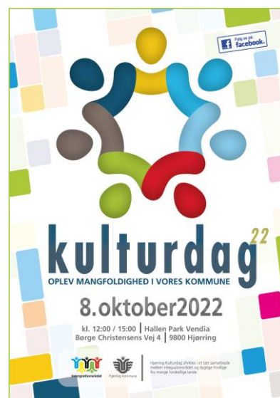
Billeder fra Seniormesse og Kulturdag